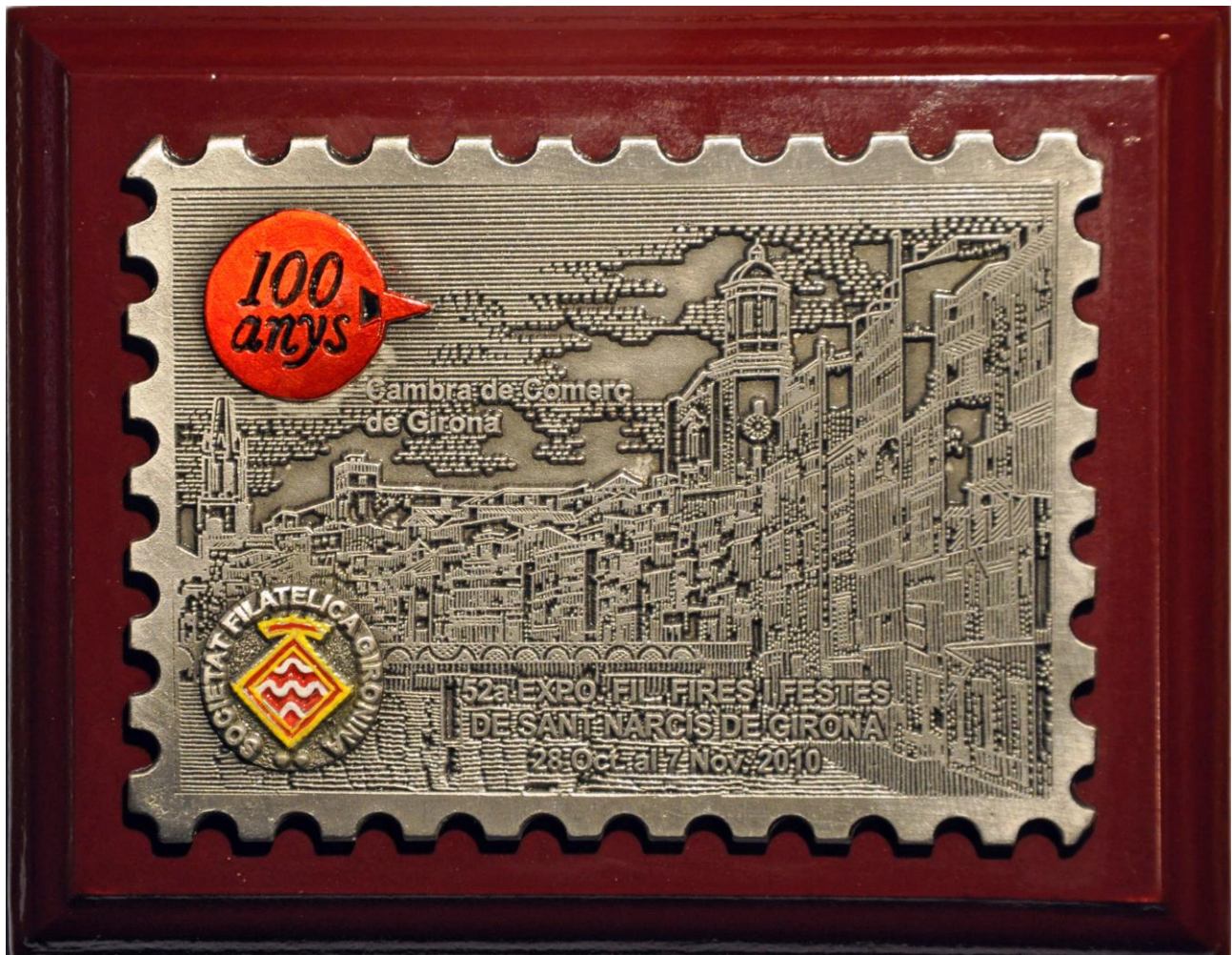
Placa-record per a tots els participants