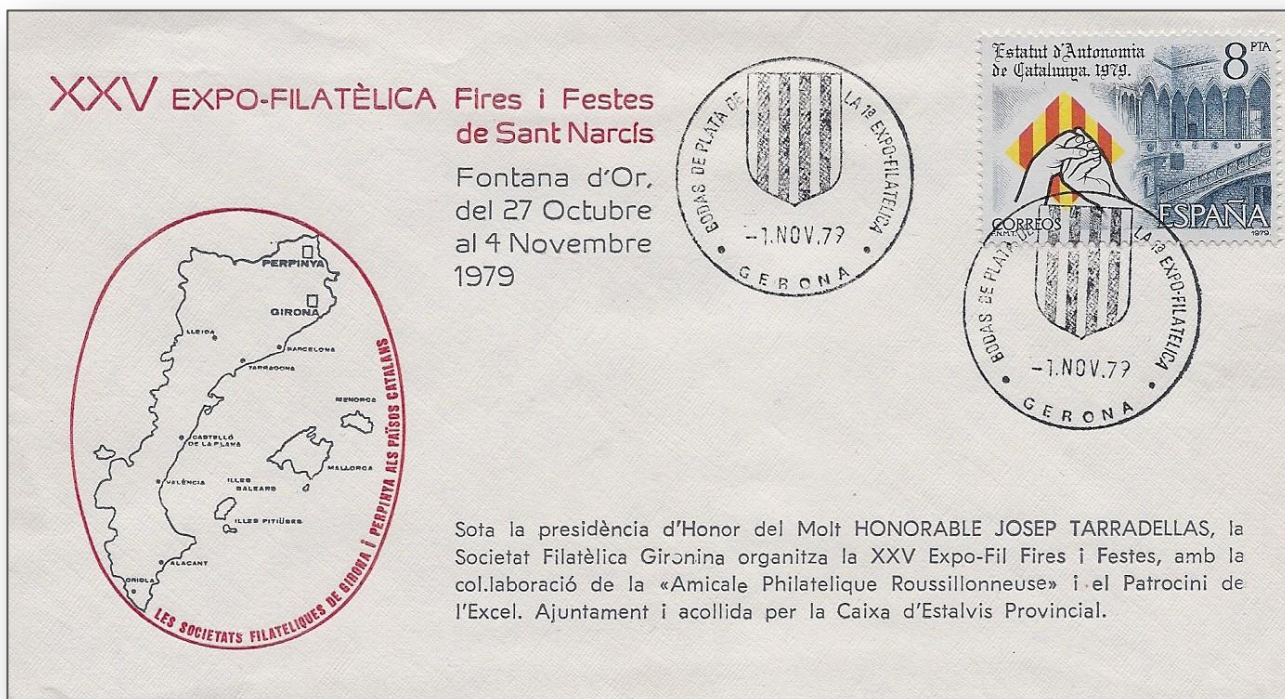
Sobre amb el mata-segells commemoratiu de la vint-i-cinc Exposició Filatèlica de la Societat Filatèlica Gironina per Fires de Gerona l'any 1979