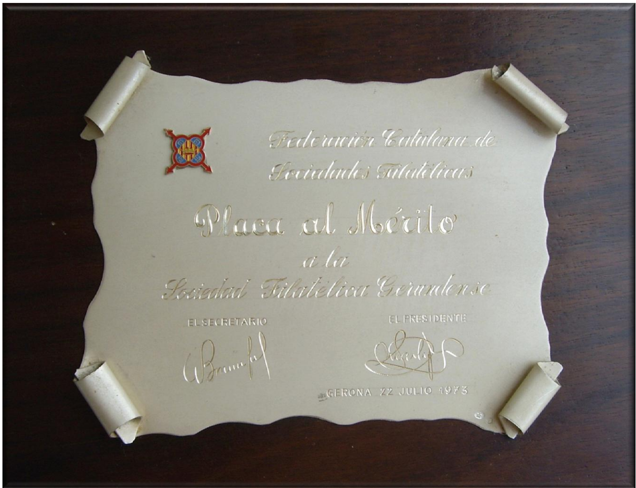
Any 1973.- Primera placa d'argent al Mèrit Filatèlic, concedida per la Federació Catalana de Societats Filatèliques