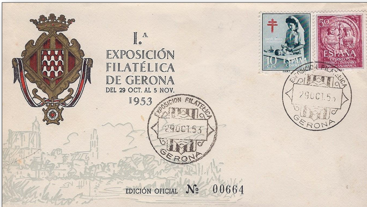
Sobre amb el mata-segells commemoratiu de la Primera Exposició Filatèlica de la Societat Filatèlica Gironina per Fires de Gerona l'any 1953